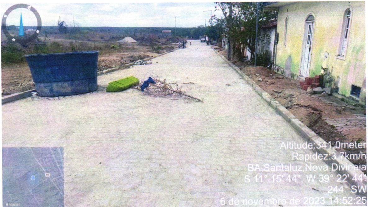
Execução de Pavimentação do Bairro Nova Divinéia, Rua F. Mascedo