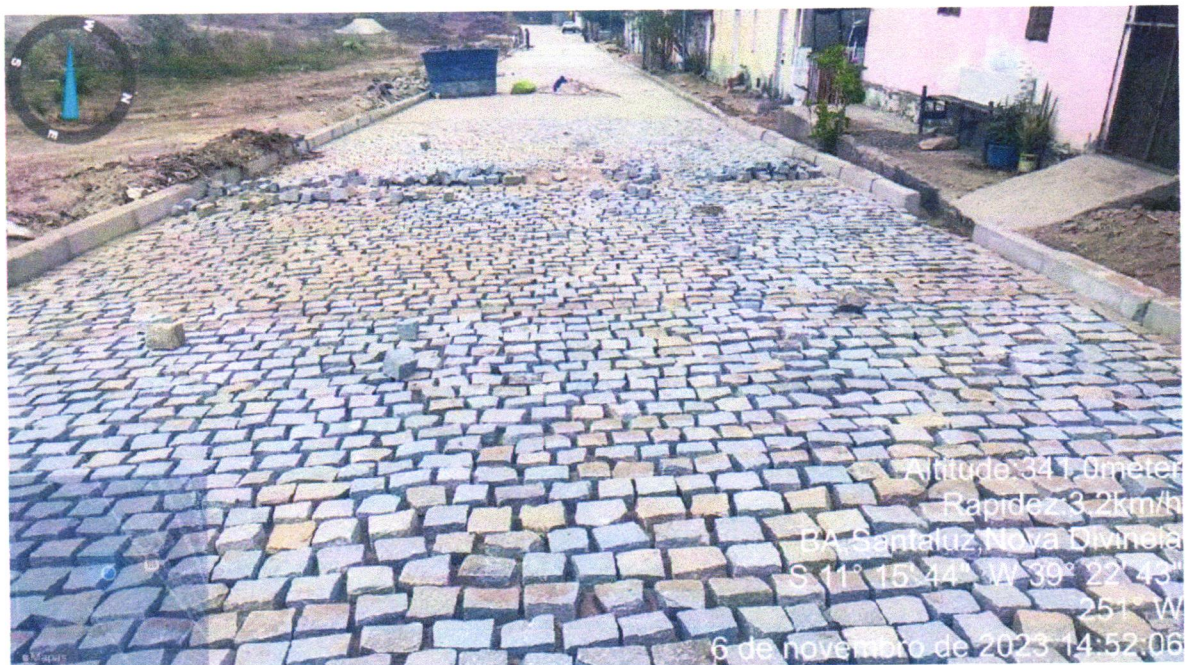
Execução de Pavimentação do Bairro Nova Divinéia, Rua F. Mascedo