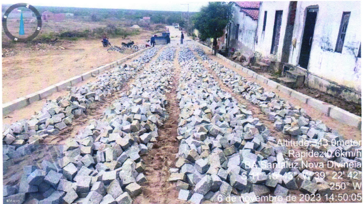
Execução de Pavimentação do Bairro Nova Divinéia, Rua F. Macedo